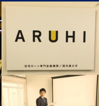
※2016.2.3 経営計画発表会にて